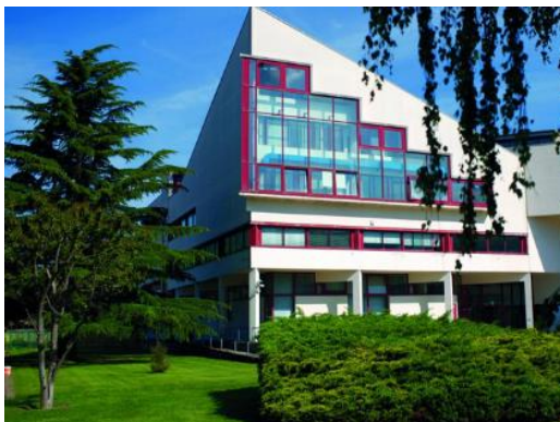
Dipartimento di Medicina, Chirurgia e Odontoiatria,

Il Master Universitario di II livello in Biostatistica è un corso di studio Interuniversitario e Interdipartimentale in partnership con l'Università di Milano Bicocca. Nasce dalla proficua collaborazione tra il Dipartimento di Medicina, con docenti provenienti dal Dipartimento di Scienze Aziendali - Management, dal Dipartimento di Scienze Economiche dell'Università degli Studi di Salerno, con docenti di Statistica e Metodi Quantitativi dell'Università di Milano Bicocca.